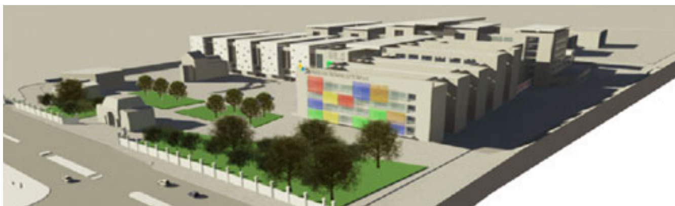
Proyección del futuro complejo hospitalario del sur de la capital.